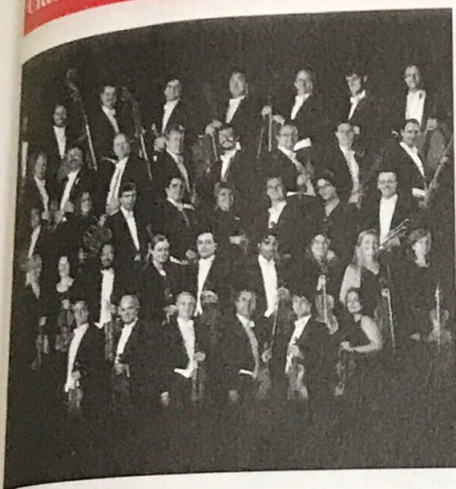
Orchestra della Svizzera Italiana